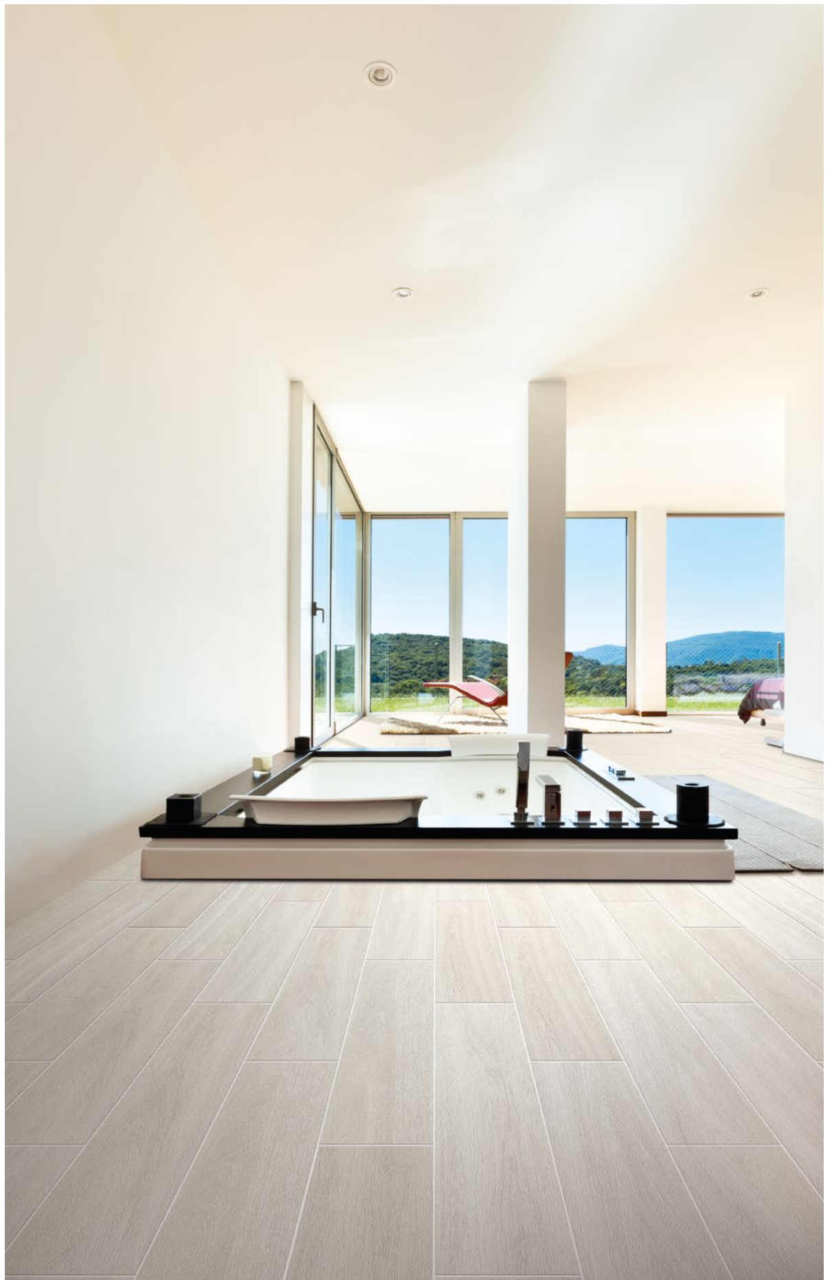
Setting made by: Doghe Sbiancato 20x120 Rettificato