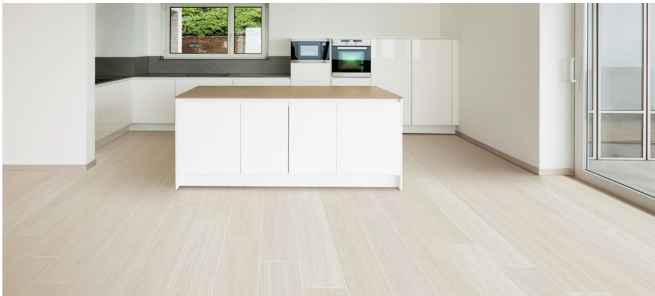
Setting made by: Doghe Sbiancato 20x120 Rettificato