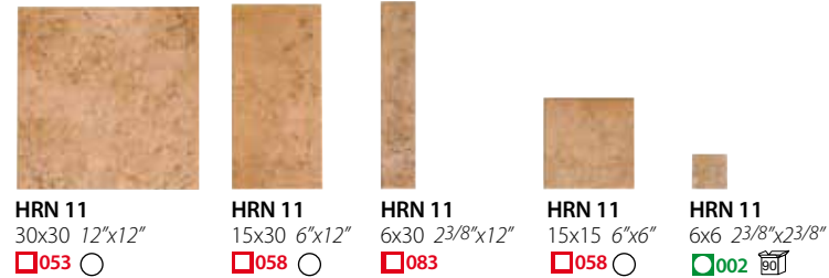
HRN 11 30x30 12"x12" ■ 053 ○ HRN 11 15x30 6"x12" ■ 058 ○ HRN 11 6x30 23/8"x12" ■ 083 ○ HRN 11 15x15 6"x6" ■ 058 ○ HRN 11 6x6 23/8"x23/8" ■ 002 □