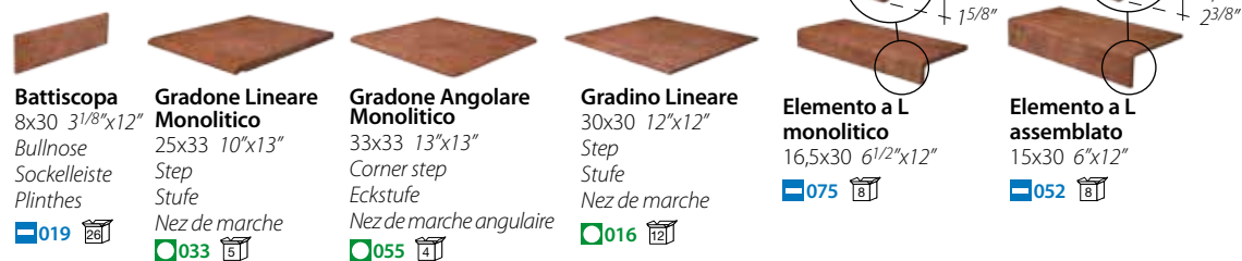
Battiscopa 8x30 3 1/8"x12" Bullnose Sockelleiste Plinthes ■ 019 □ Gradone Lineare Monolitico 25x33 10"x13" Step Stufe Nez de marche ■ 033 □ Gradone Angolare Monolitico 33x33 13"x13" Corner step Eckstufe Nez de marche angulaire ■ 055 □ Gradino Lineare 30x30 12"x12" Step Stufe Nez de marche ■ 016 □ Elemento a L monolitico 16,5x30 6 1/2"x12" ■ 075 □ Elemento a L assemblato 15x30 6"x12" ■ 052 □