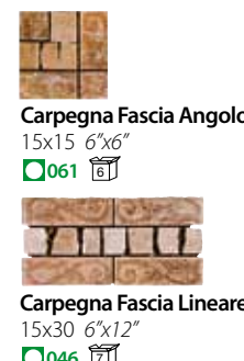
Carpegna Fascia Angolo 15x15 6"x6" ■ 061 □ Carpegna Fascia Lineare 15x30 6"x12" ■ 046 □