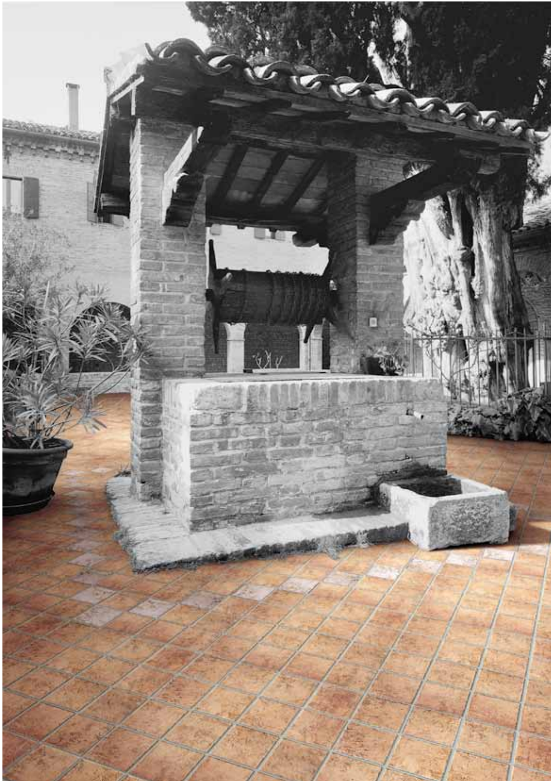
HRN 11 - HRN 5