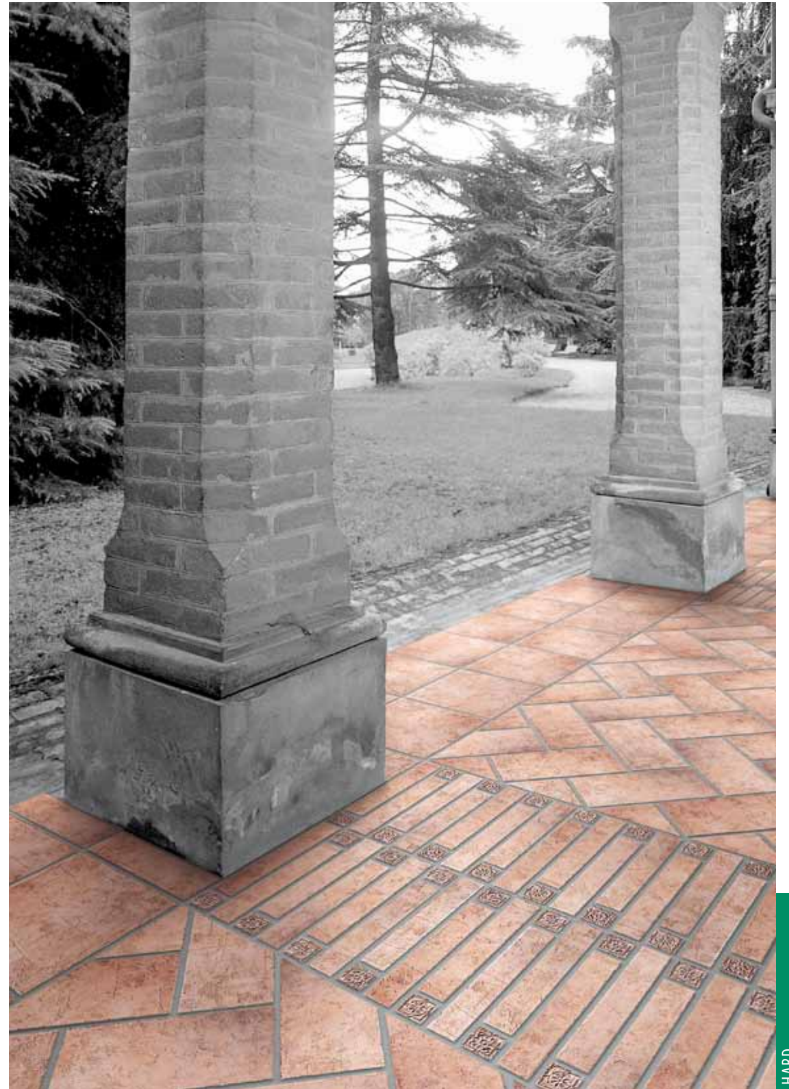
HRN 4 - Carpegna A