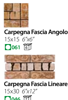
Carpegna Fascia Angolo 15x15 6"x6" ■ 061 □ Carpegna Fascia Lineare 15x30 6"x12" ■ 046 □