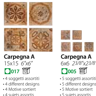
Carpegna A 15x15 6"x6" ■ 017 □ Carpegna A 6x6 23/8"x23/8" ■ 005 □ • 4 soggetti assortiti • 4 different designs • 4 Motive sortiert • 4 sujets assortis