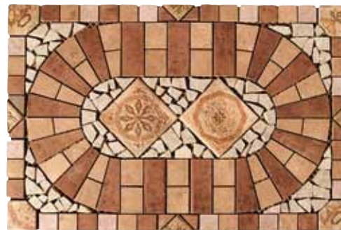
Carpegna Tappeto 60x90 24"x36" ■ 432 □