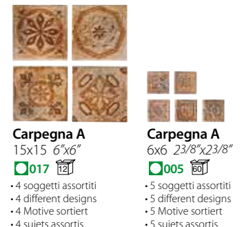
Carpegna A 15x15 6"x6" ■ 017 □ Carpegna A 6x6 23/8"x23/8" ■ 005 □ • 4 soggetti assortiti • 4 different designs • 4 Motive sortiert • 4 sujets assortis