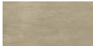
HEV 8 Grip 30x60 12"x24" 061