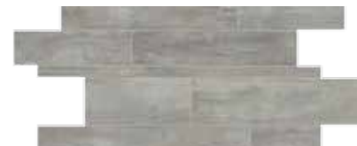
Muretto / HEV 5 30x60 12"x24" 040