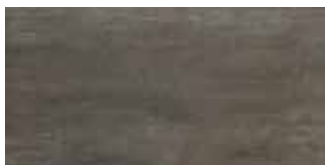
HEV 18 Grip 30x60 12"x24" 061