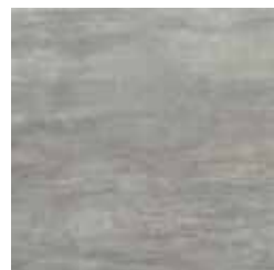
HEV 5 45x45 18"x18" 056