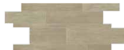
Muretto / HEV 8 30x60 12"x24" 040