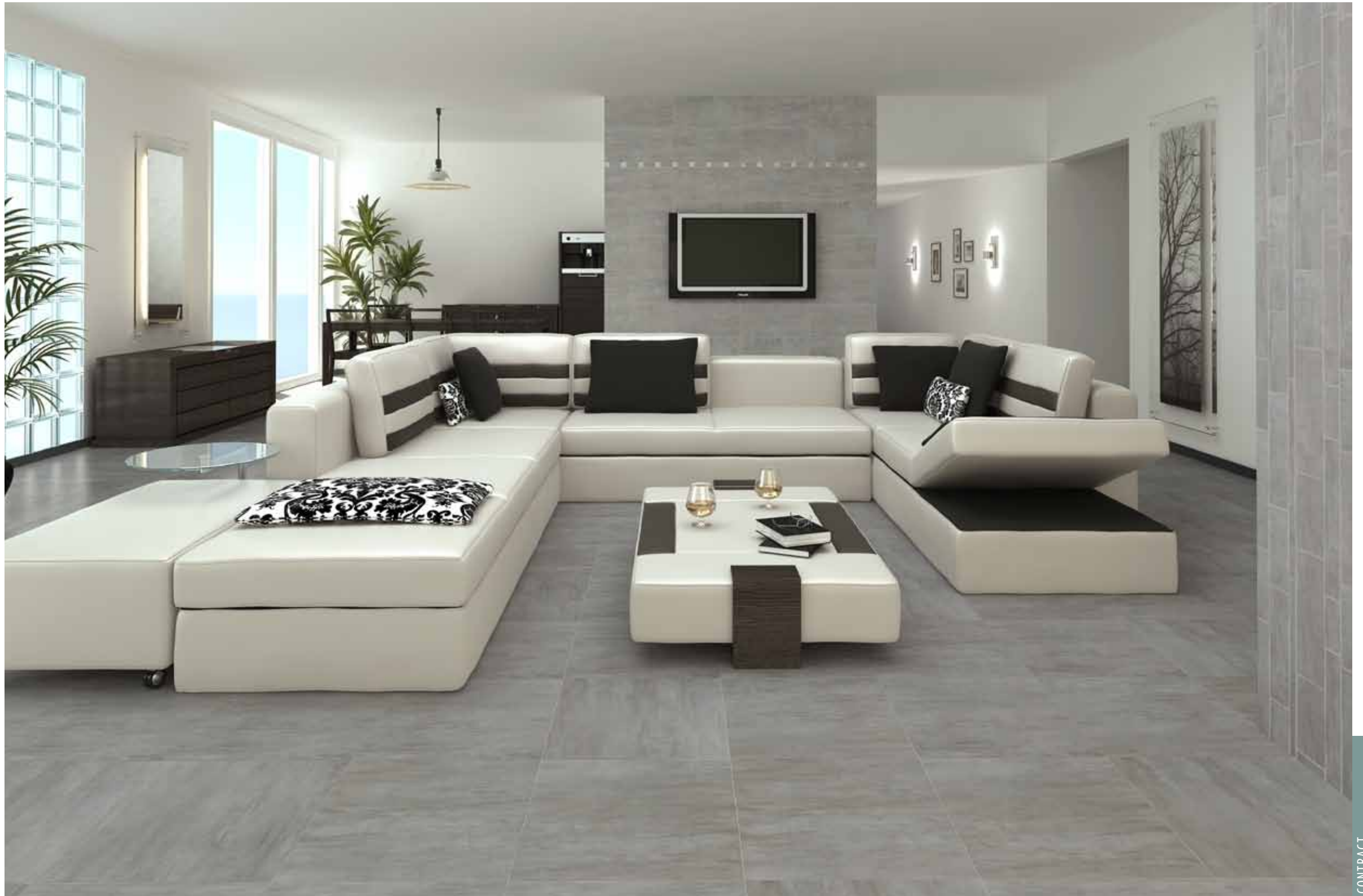
HEV 5 - Fascia Evolution / HEV 5 - Muretto / HEV 5