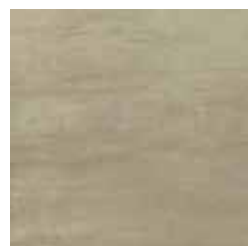
HEV 8 45x45 18"x18" 056