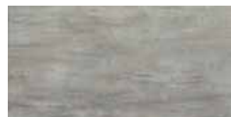
HEV 5 Grip 30x60 12"x24" 061