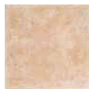
TR 4 33,3x33,3 13"x13" 048