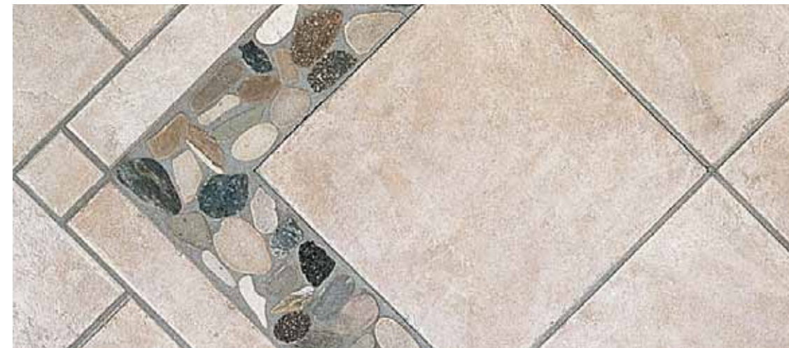
TR 9 - Sassi B