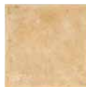
TR 1 33,3x33,3 13"x13" 048