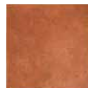
TR 6 33,3x33,3 13"x13" 048