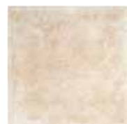
TR 9 33,3x33,3 13"x13" 048