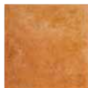
TR 11 33,3x33,3 13"x13" 048