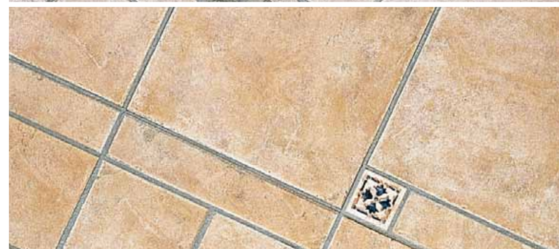
TR 1 - Torriana A