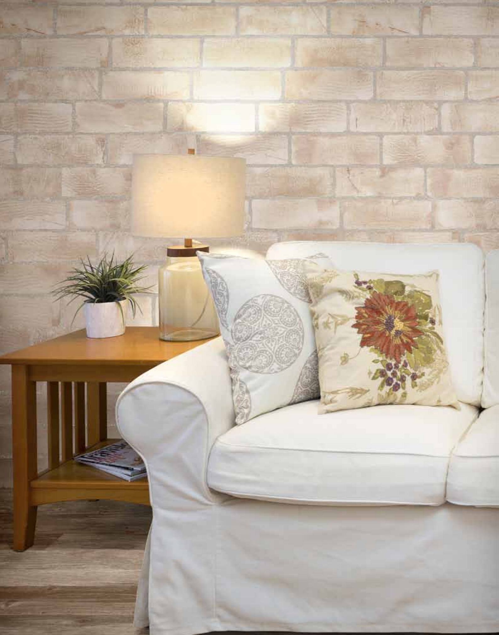
Rivestimento / Wall: MA 10 Pavimento / Floor: DV 9 Rett.