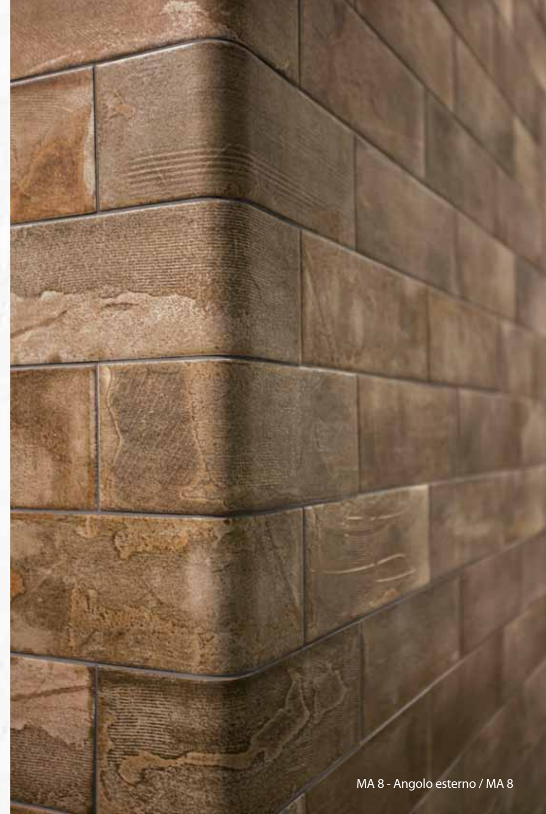
MA 8 - Angolo esterno / MA 8

L'assortiment des sujets dans la boîte est aléatoire.