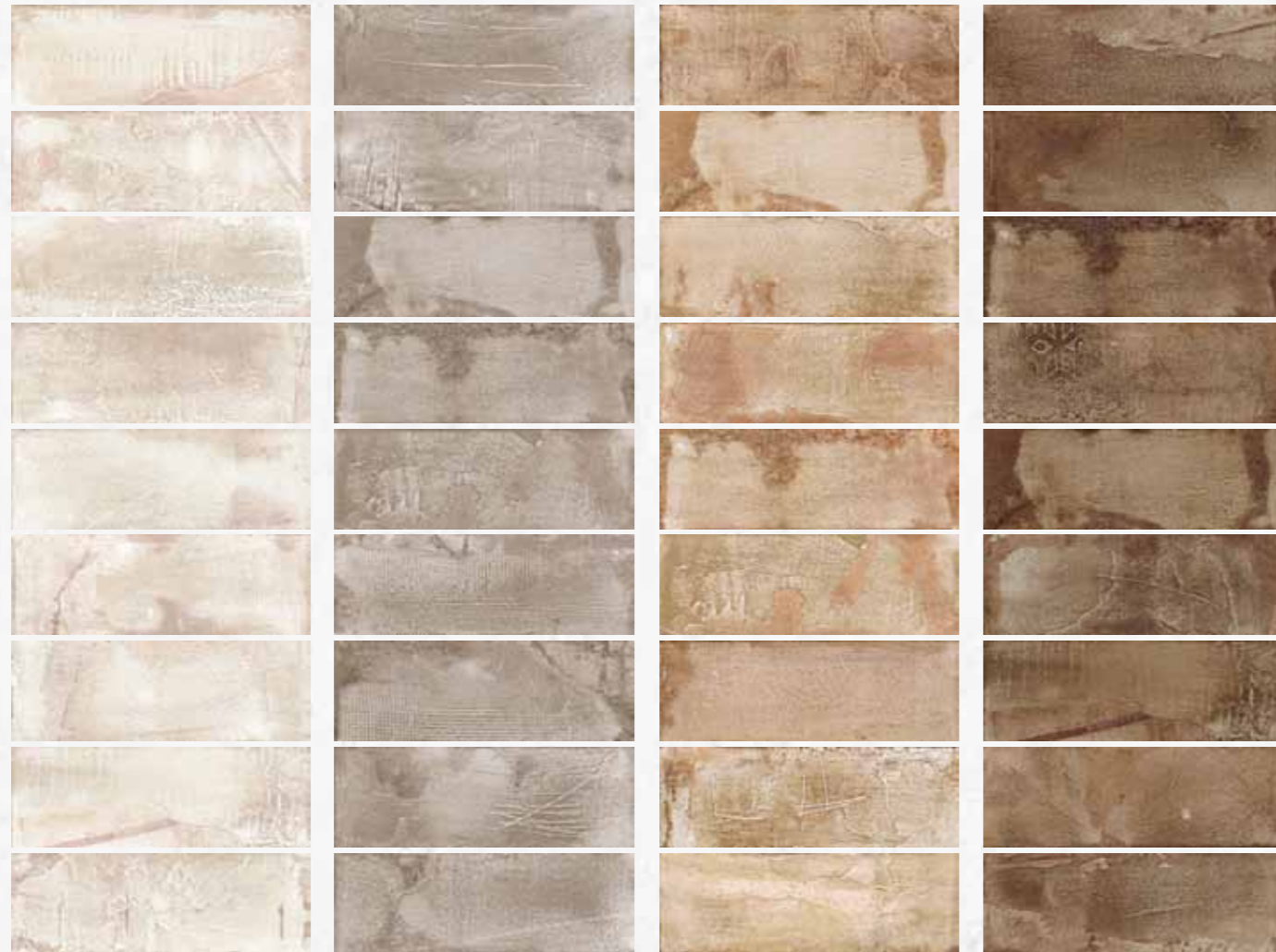
MA10 / Bianco 10x30 4"x12" 092