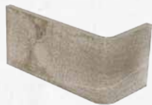
Angolo esterno 10x20x10 4"x8"x4" Out corner Angle extérieur Aussenecke 030

Pezzi Speciali Special Pieces • Formteile • Pièces spéciales Disponibili nei colori: - Available on colours: - Formteile in den Farben: - Disponibles dans les couleurs: MA 10 - MA 5 - MA 1 - MA 8 - Writers