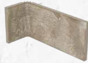
Angolo interno 10x20x10 4"x8"x4" Out corner Angle extérieur Aussenecke 030

L'assortimento dei soggetti all'interno della scatola è casuale.