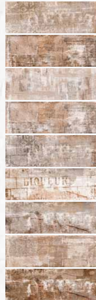
Writers 10x30 4"x12" 109 • Soggetti assortiti • Different designs • Motive sortiert • Sujets assortis

Pezzi Speciali Special Pieces • Formteile • Pièces spéciales Disponibili nei colori: - Available on colours: - Formteile in den Farben: - Disponibles dans les couleurs: MA 10 - MA 5 - MA 1 - MA 8 - Writers