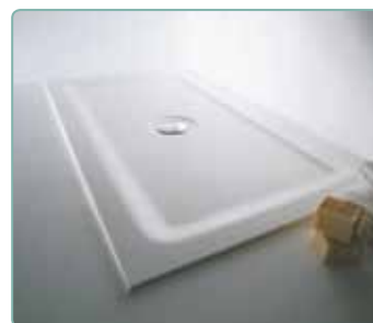
Abbinabili a piatto doccia samo (vedere pagine area dedicata)