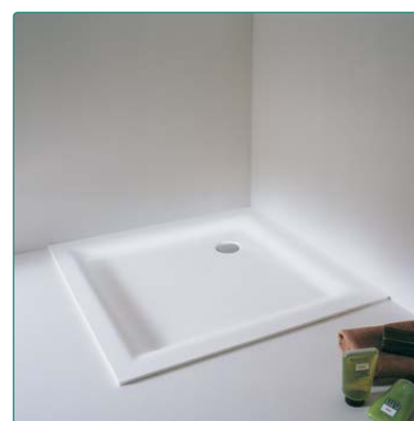
Abbinabili a piallo doccia samo (vedere pagine area dedicata)