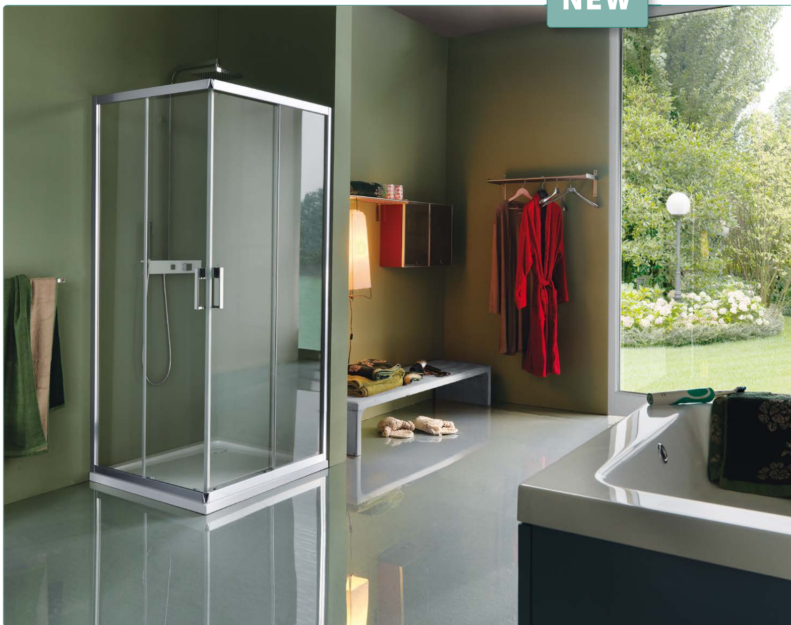
Cabina doccia, art. B0920ULUTR Piatto doccia, art. D1190C01 Sistema doccia, art. YA1015.121CRO

Angolo a quattro ante, apertura ad ante scorrevoli, due fisse e due apribili. Reversibile all'atto dell'installazione.