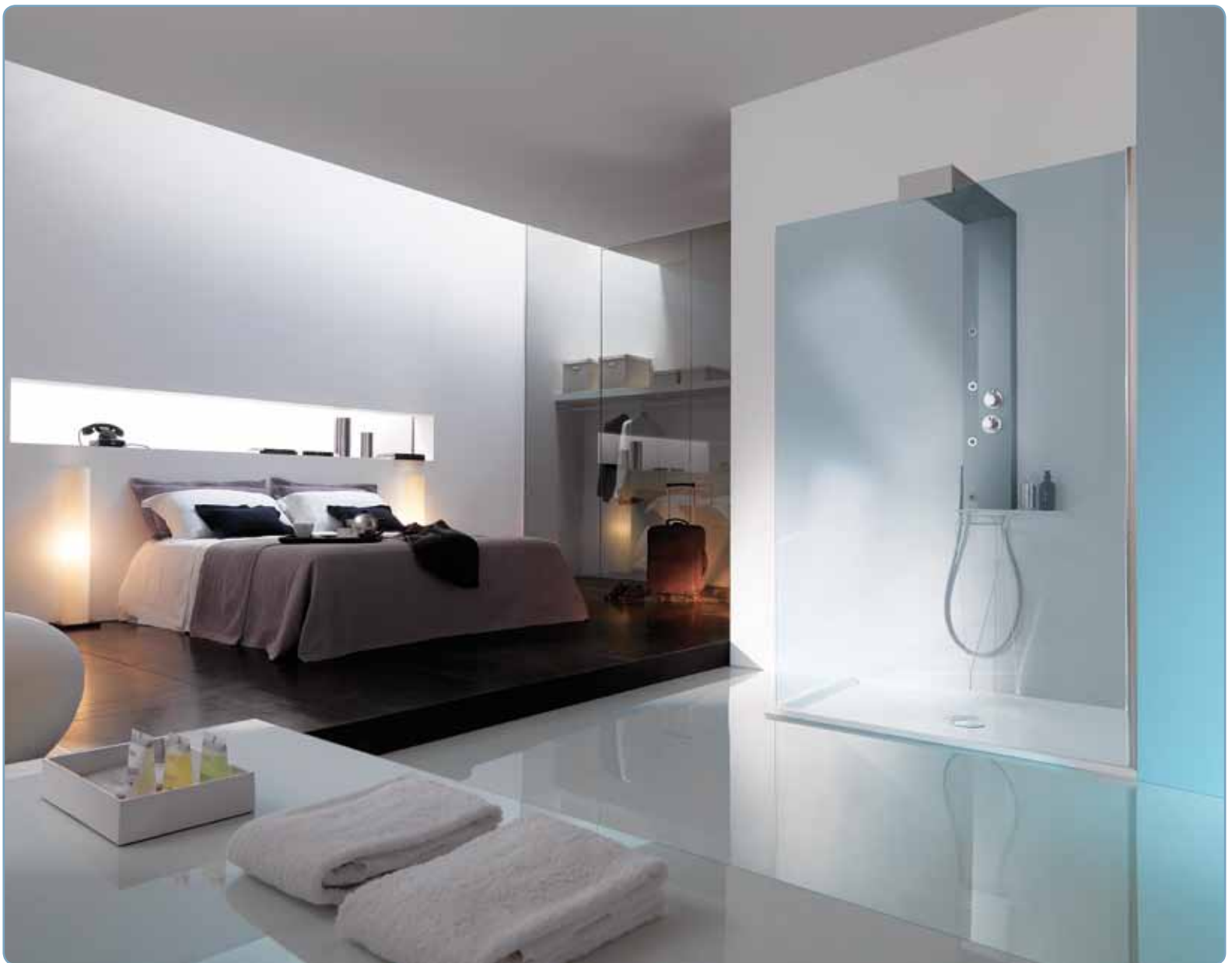
Cabina doccia, art. B4982ULUTR Colonna doccia, art. KR2000SAS Piatto doccia, art. D4982L01

Cabina doccia spaziosa caratterizzata da area di accesso dedicata e anta fissa. Il vano di accesso alla doccia è totalmente libero con apertura di 77 cm. È possibile il montaggio anche senza piatto doccia: una guarnizione inferiore consente di isolare la parete in vetro dal piano di appoggio.