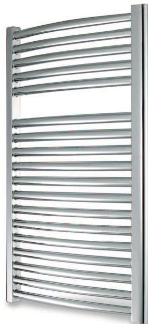
Tekno Curvo Cromato

Emballage: Emballé en film thermorétractable et ensuite en boîte de carton avec consoles et purgeur de 1/2"