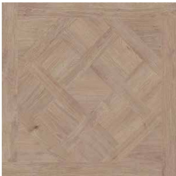
302840/61 95 * Cassettone Cannella Rettificato 81x81 3