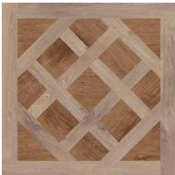
302842/61 95 * Cassettone Mix Sandalo Rettificato 81x81 3