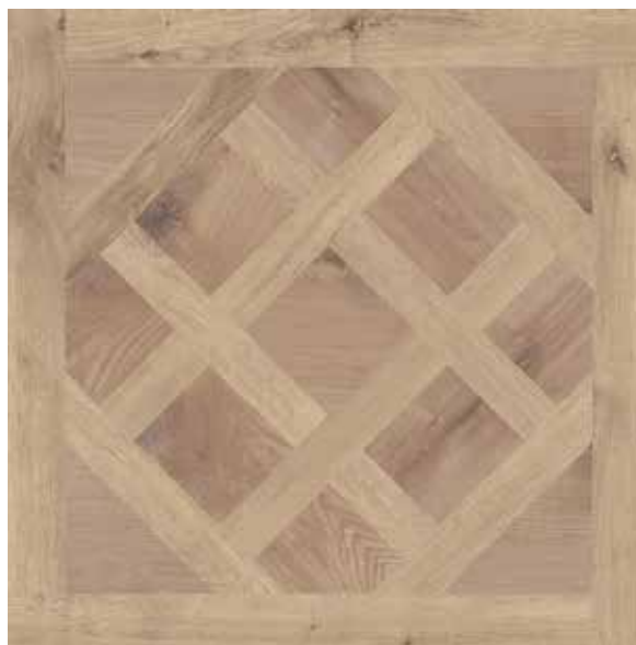
302841/61 95 * Cassettone Mix Vaniglia Rettificato 81x81 3