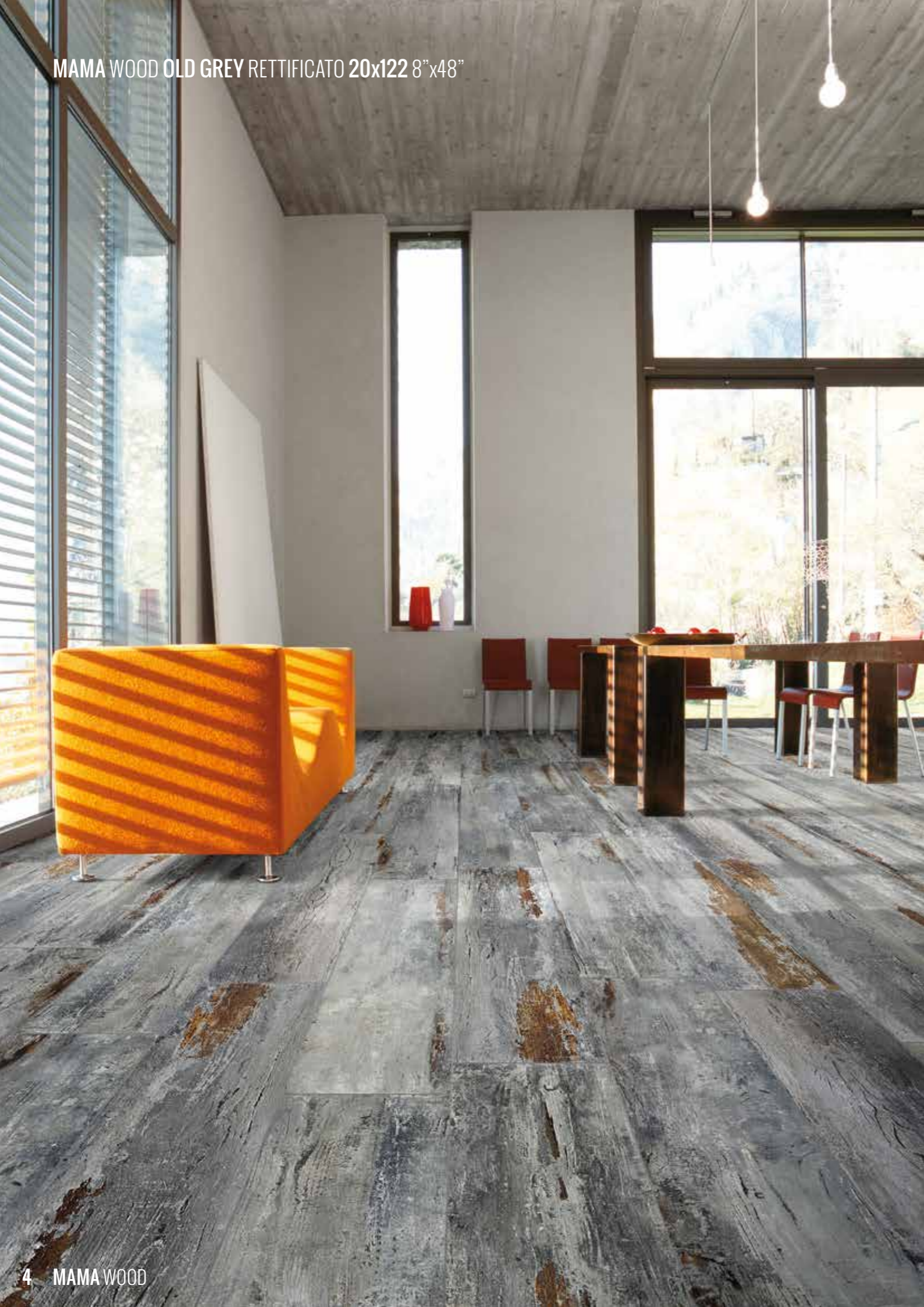
MAMA WOOD OLD GREY RETTIFICATO 20x122 8"x48"