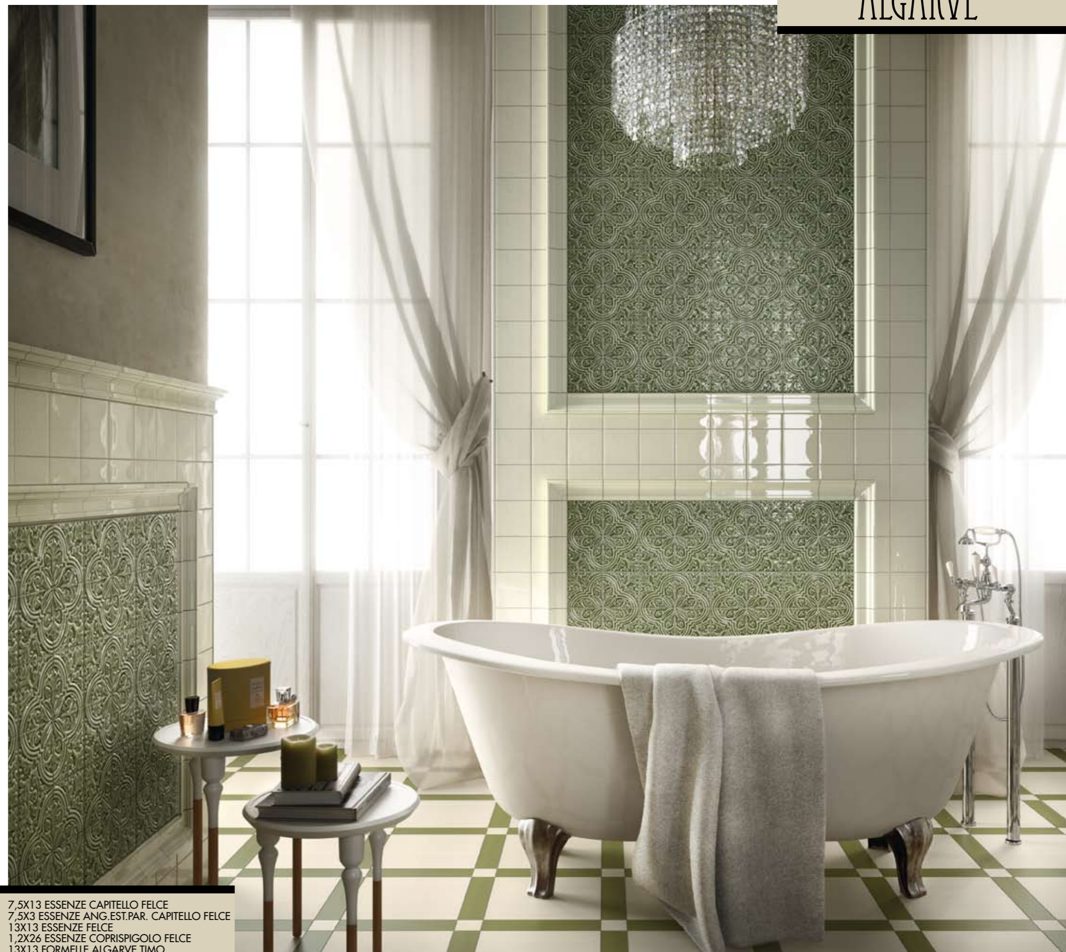
7,5X13 ESSENZE CAPITELLO FELCE 7,5X3 ESSENZE ANG.EST.PAR. CAPITELLO FELCE 13X13 ESSENZE FELCE 1,2X26 ESSENZE COPRISPIGOLO FELCE 13X13 FORMELLE ALGARVE TIMO PAVIMENTO/FLOOR 30X30 RETRO2 MOON 6,5X6,5 RETRO2 TOZZ.LIS. MOON 6,5X30 RETRO2 LISTELLO SAGE