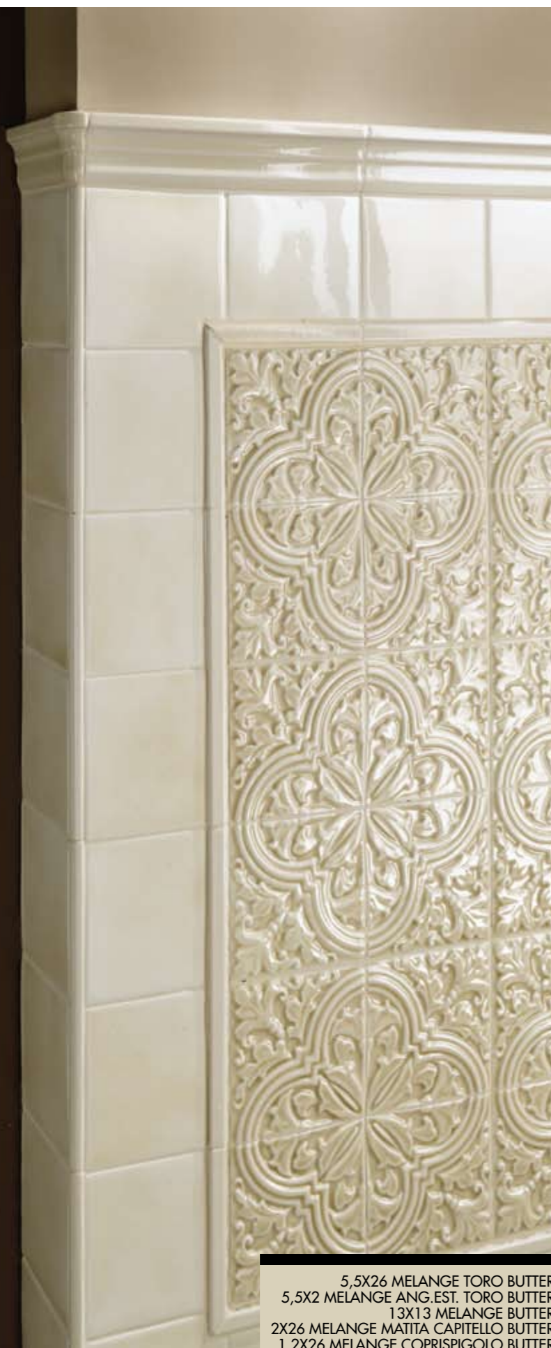
5,5X26 MELANGE TORO BUTTER 5,5X2 MELANGE ANG.EST. TORO BUTTER 13X13 MELANGE BUTTER 2X26 MELANGE MATITA CAPITELLO BUTTER 1,2X26 MELANGE COPRISPIGOLO BUTTER 13X13 FORMELLE ALGARVE AMBRA