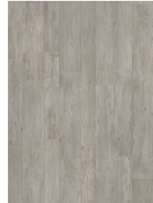
30x120 . 12"x48" RT 20x120 . 8"x48" RT