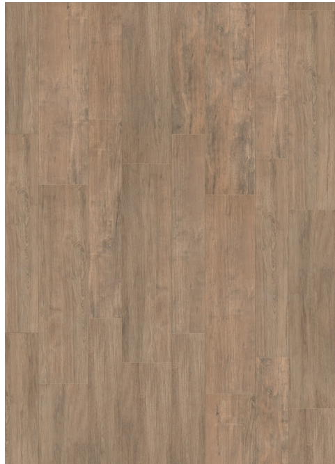
30x120 . 12"x48" RT 20x120 . 8"x48" RT