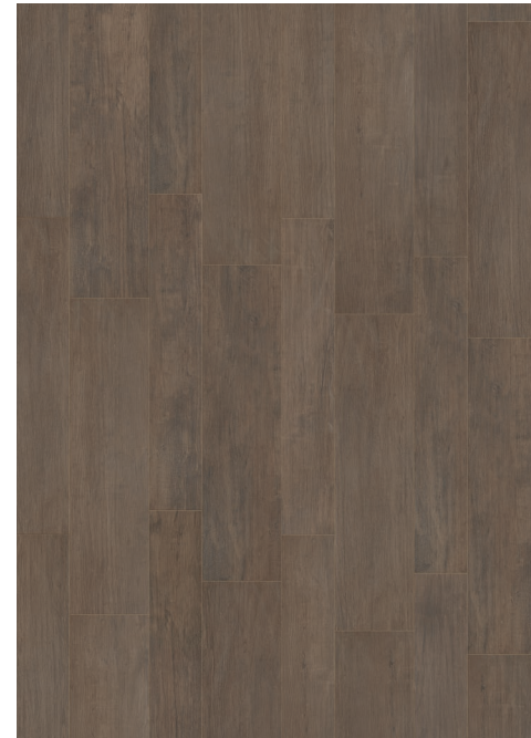
30x120 . 12"x48" RT 20x120 . 8"x48" RT