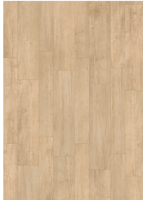
30x120 . 12"x48" RT 20x120 . 8"x48" RT