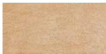
P13120B Signorie Fiorentine Beige 15,3x30,6 / 6"x12" ■ 7 PEI IV