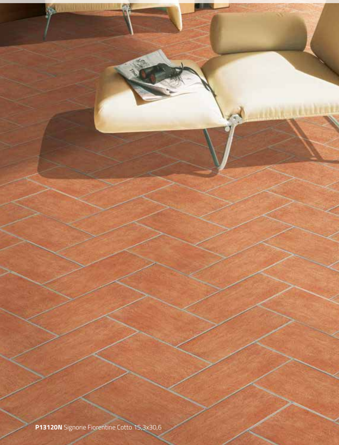
P13120N Signorie Fiorentine Cotto 15,3x30,6