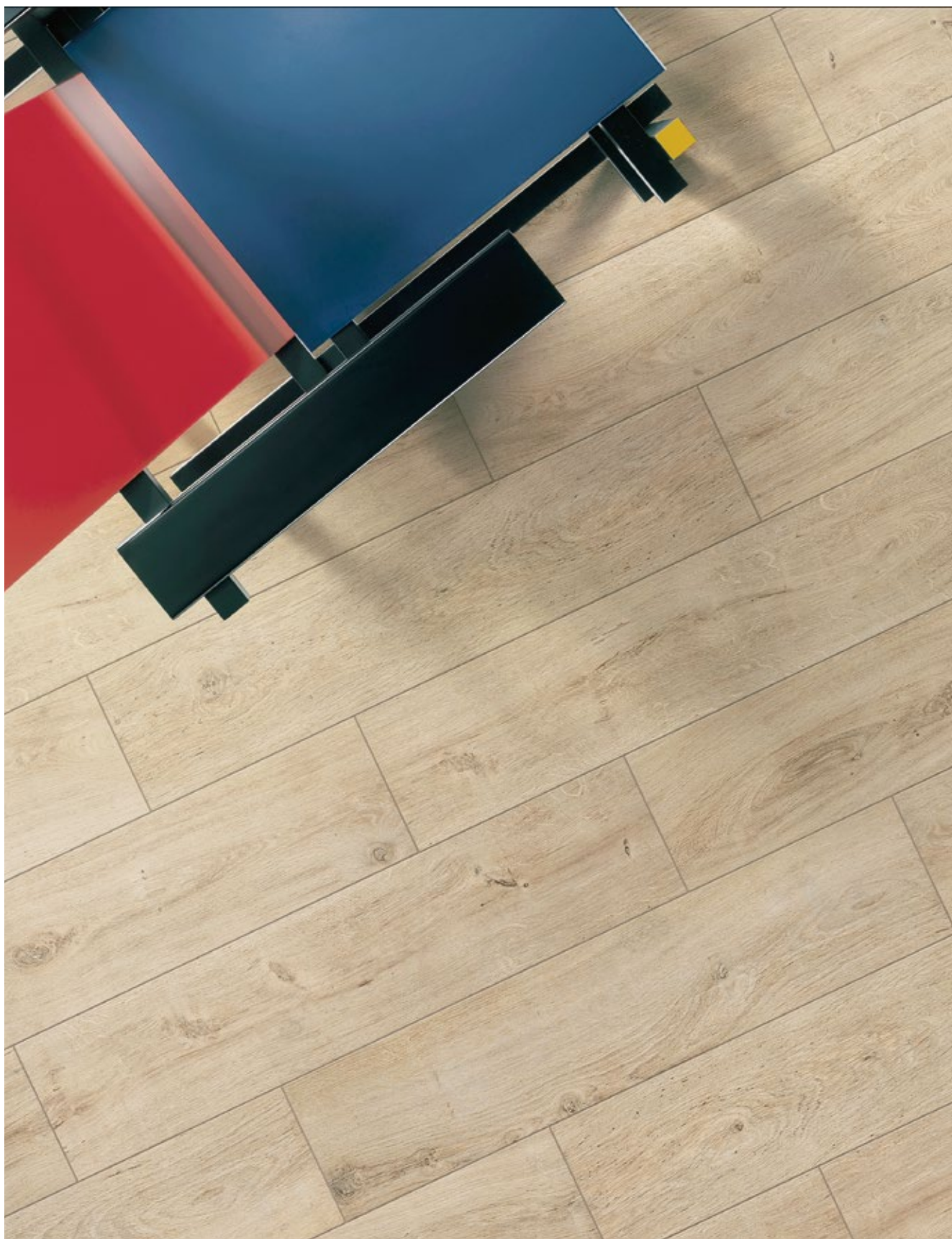
Pavimento / Floor: Klimt 20x90,5