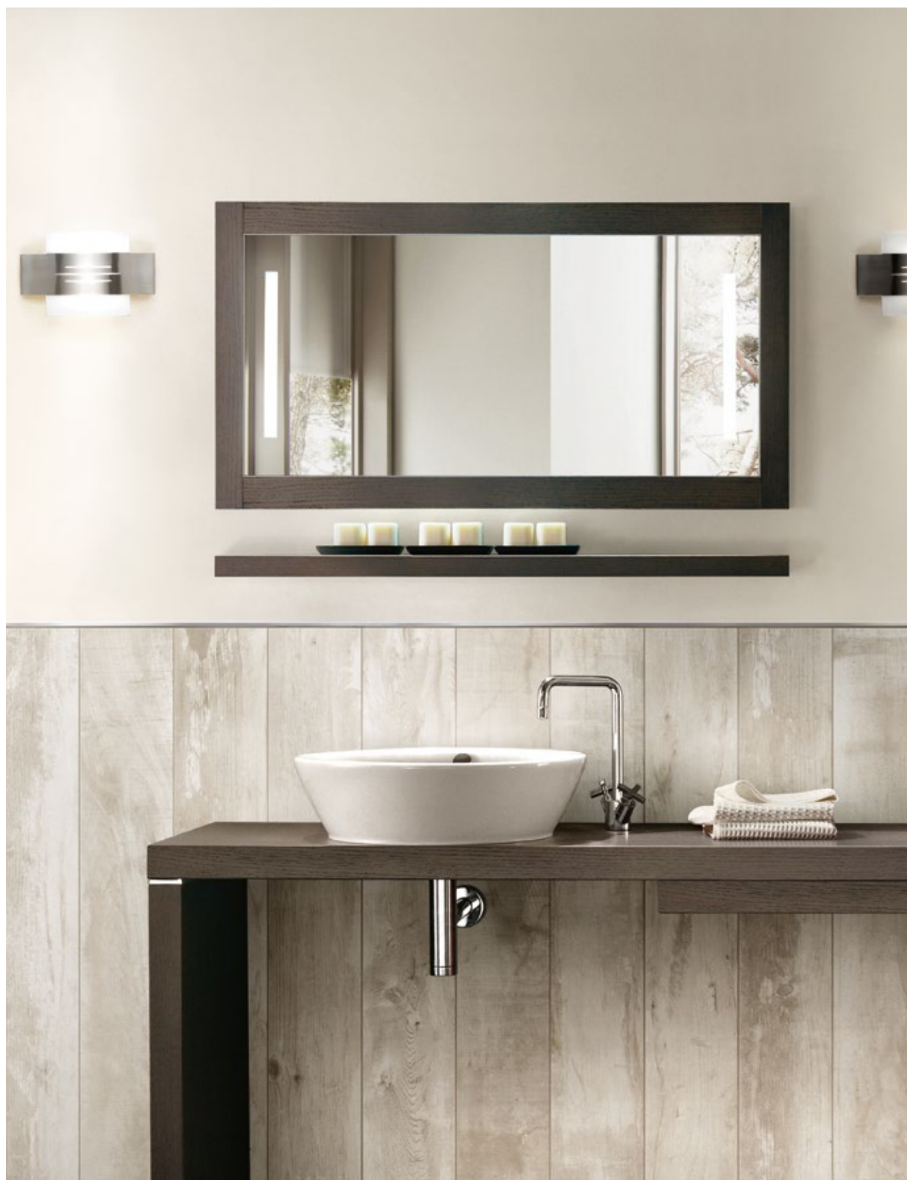
Rivestimento / Wall: Florida 20x121,5