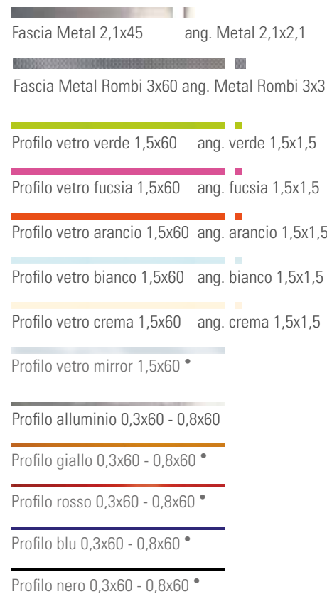
Fascia Metal 2,1x45 ang. Metal 2,1x2,1