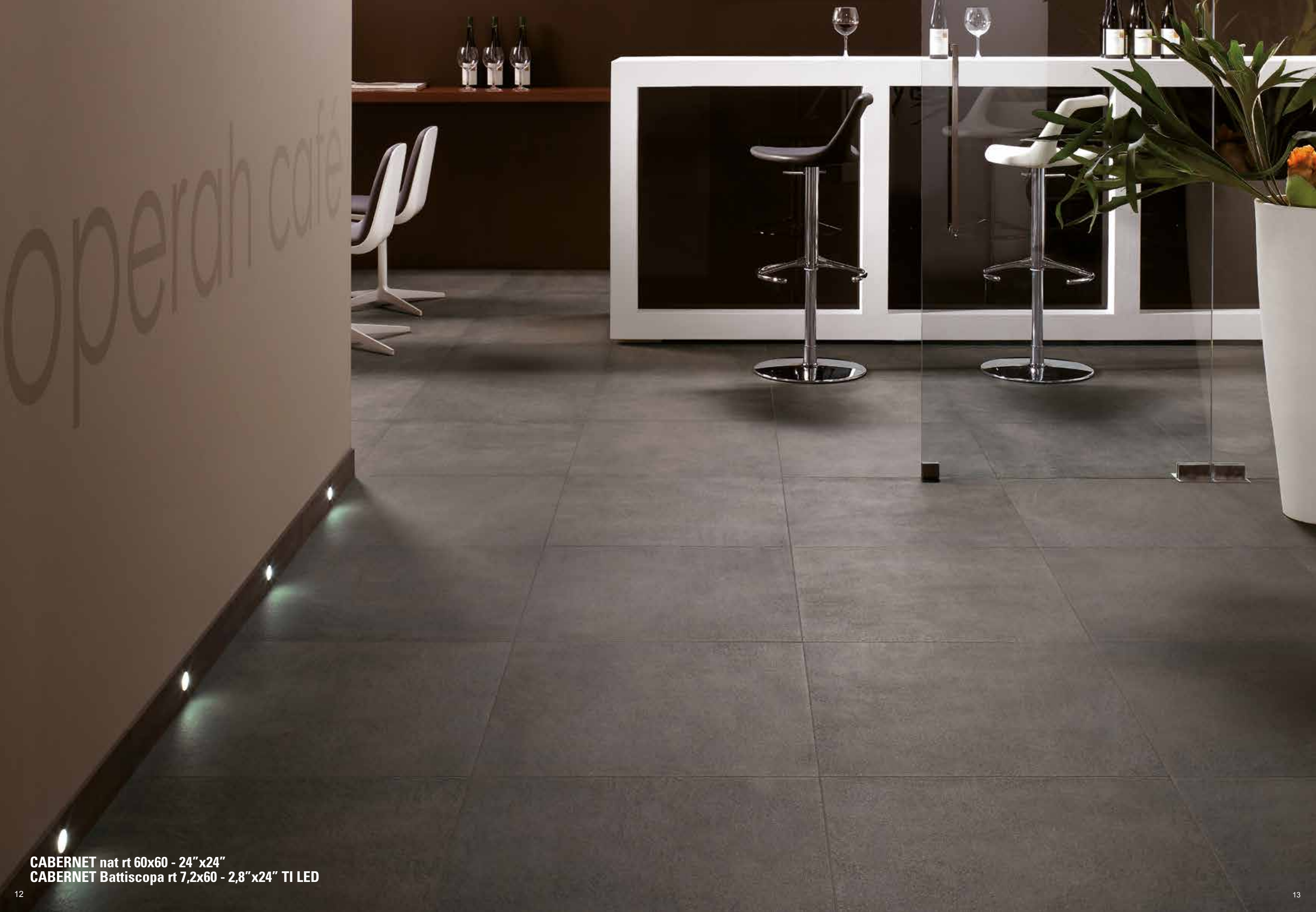
CABERNET nat rt 60x60 - 24"x24" CABERNET Battiscopa rt 7,2x60 - 2,8"x24" TI LED