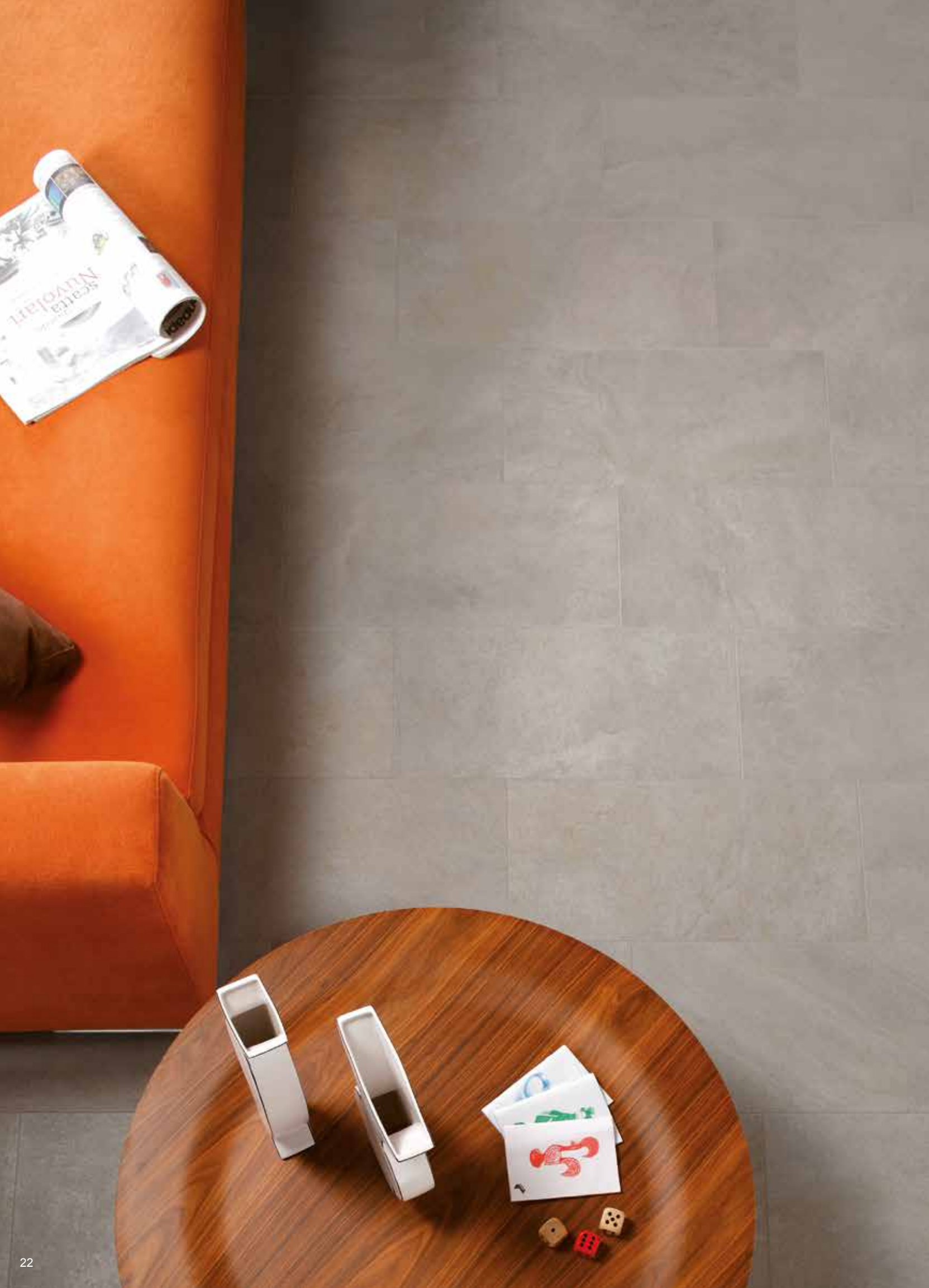
SMOKE nat rt 30x60 - 12"x24"