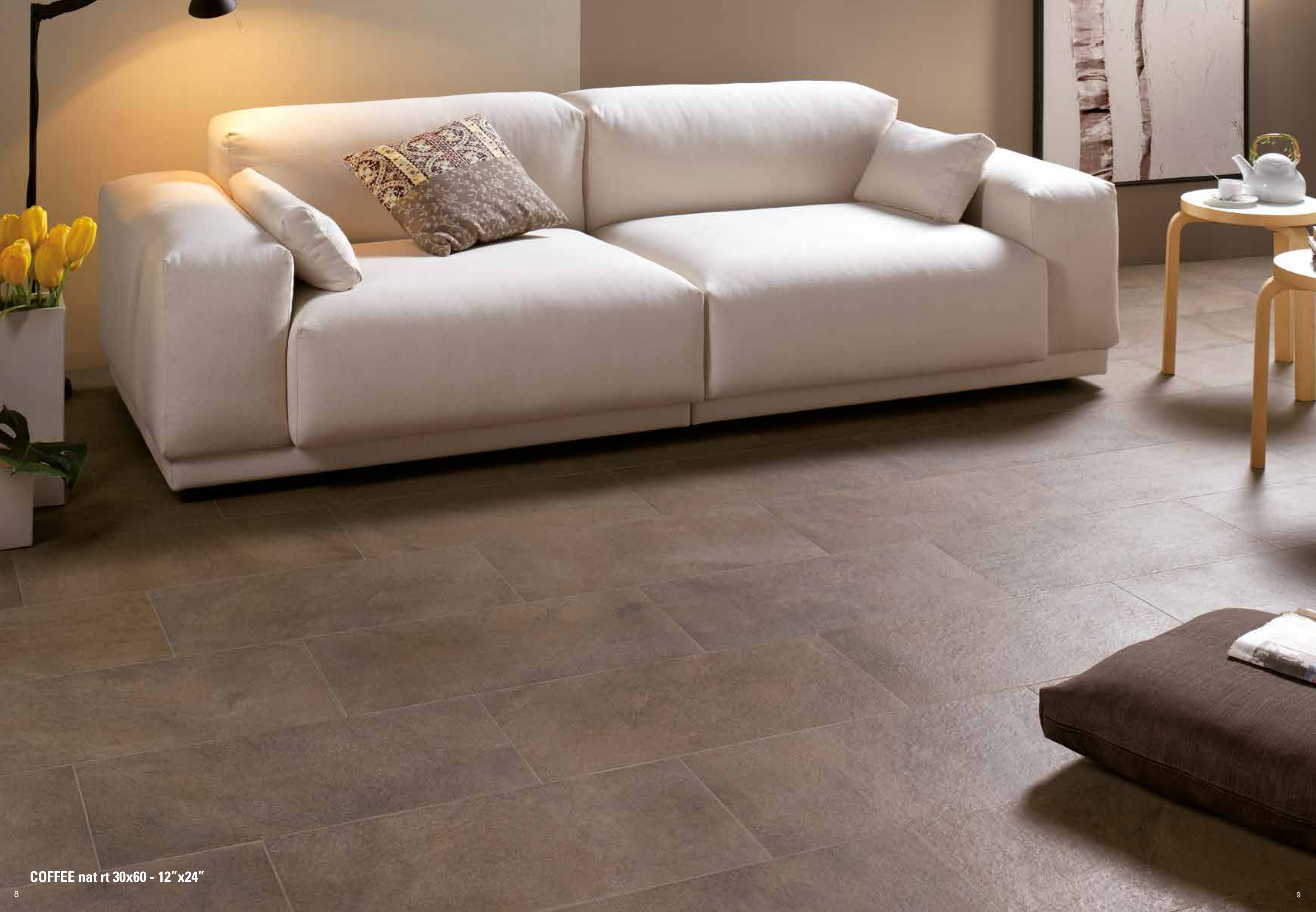
COFFEE nat rt 30x60 - 12"x24"