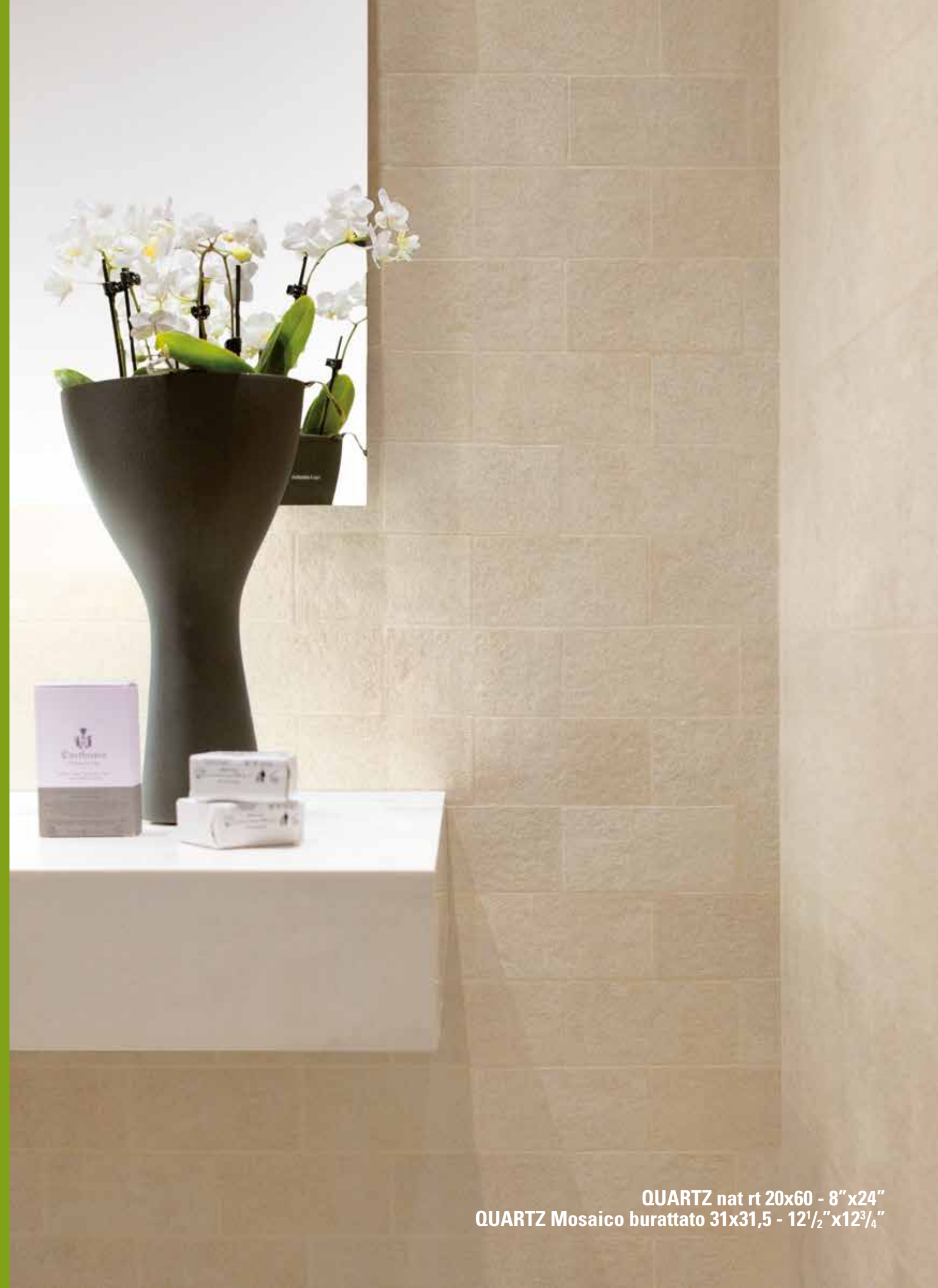
QUARTZ nat rt 20x60 - 8"x24" QUARTZ Mosaico burattato 31x31,5 - 12 1 / 2 "x12 3 / 4 "