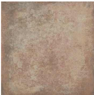
Ayodar | Novedad 33.3x33.3