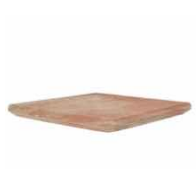
Peldaño Fiorentino Angular A...