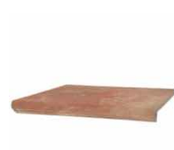
Peldaño Fiorentino Ayodar