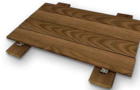
Tavole in TERMO FRASSINO spess.19/21 x largh.95 o 120 x lungh.1000/3000 mm ca. Con o senza zigrinatura antiscivolo e fresatura per clips. THERMO ASH approx. thickness 19/21 x width 95 o 120 x length 1000/3000 mm. Smooth or with non-slip ridges and clip grooves.