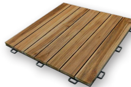
Quadrotte precomposte in TERMO TEAK con zigrinatura antiscivolo. Spess.30/31 x largh.550 x lungh.550 mm su supporto in resina. Pre-Composed THERMO TEAK bloks with non-slip ridges thickness 30/31 x width 550 x length 550 mm. with plastic resin grid base.