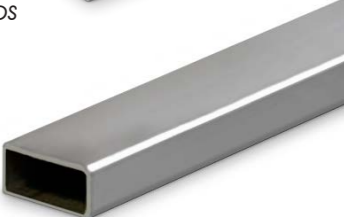
Profilo in alluminio Aluminium profiles 25 h x 45 x 3000 mm.

Massaranduba zigrinato larghezza 90mm posa regolare fissato su magatello in Massaranduba con viti in acciaio a vista. Massaranduba: with non-slip ridges 90mm width regular-laying fixed on Massaranduba joists with steel screws at sight.