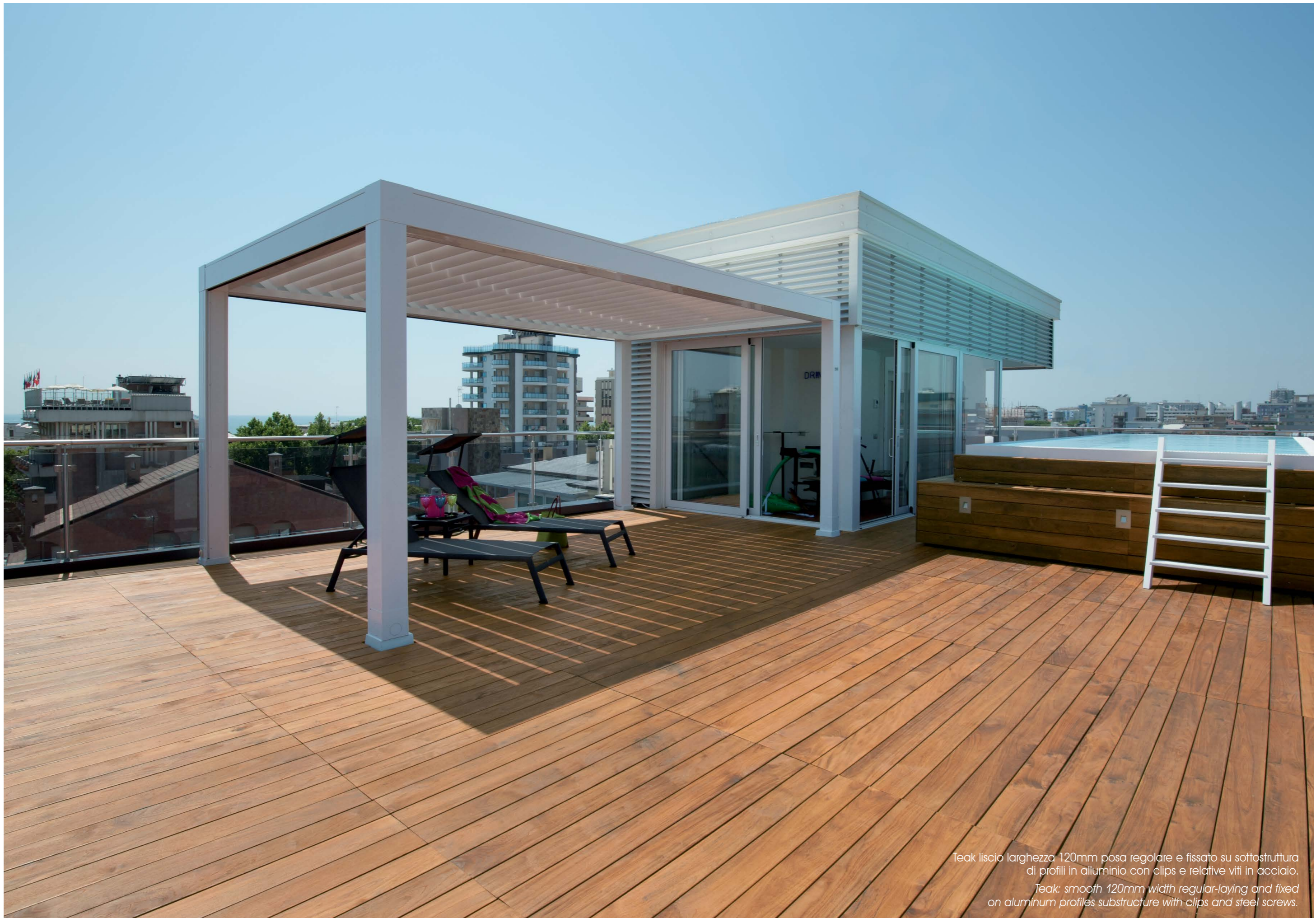
Teak liscio larghezza 120mm posa regolare e fissato su sottostruttura di profili in alluminio con clips e relative viti in acciaio. Teak: smooth 120mm width regular-laying and fixed on aluminum profiles substructure with clips and steel screws.