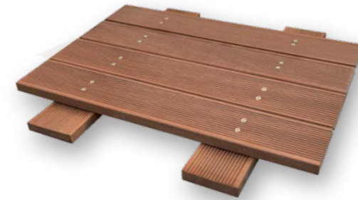
Tavole MASSARANDUBA spess.19/21 x largh.90 x lungh.900/2700 mm ca. Con zigrinatura antiscivolo. Posa esclusivamente con viti in acciaio a vista. MASSARANDUBA approx. thickness 19/21 x width 90 x length 900/2700 mm. With non-slip ridges. Laying only with steel screws at sight.