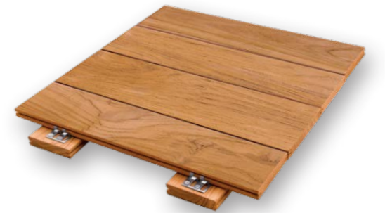
Tavole in TEAK spess.19/21 x largh.90 o 120 x lungh.900/2500 mm ca. Con o senza zigrinatura antiscivolo e fresatura per clips. TEAK approx. thickness 19/21 x width 90 o 120 x length 900/2500 mm. Smooth or with non-slip ridges and clip grooves.