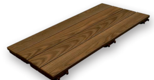
Tavole precomposte accoppiate in TERMO FRASSINO senza zigrinatura antiscivolo. Spess.31 x largh.199 x lungh.795 mm. Con supporto in resina. Pre-composed coupled boards in THERMO ASH smooth thickness 31 x width 199 x length 795 mm. With plastic resin grid base.