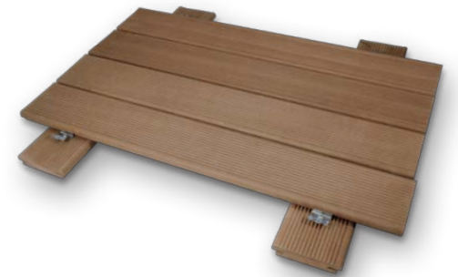
Tavole IPE' LAPACHO spess.19/21 x largh.90 x lungh.900/2700 mm. Con o senza zigrinatura antiscivolo e fresatura per clips. IPE' LAPACHO BOARDS thickness 19/21 x width 90 x length 900/2700 mm. Smooth or with non-slip ridges and clip grooves.